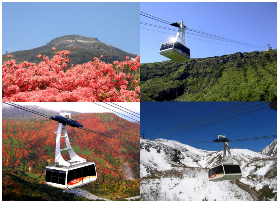
三線交走式普通索道